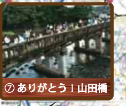
⑦ ありがとう！山田橋