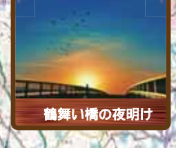
鶴舞い橋の夜明け