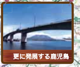
更に発展する鹿児島