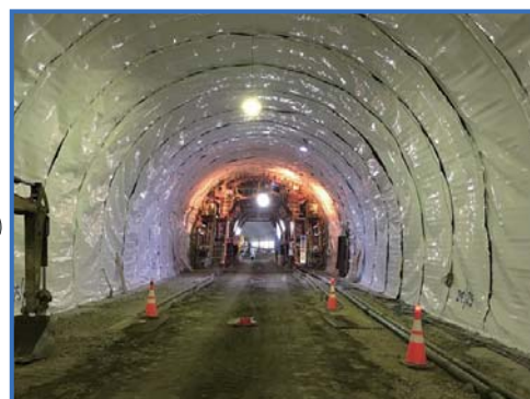
黎明トンネル(現場見学)